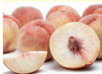
川中島白桃(8月中旬~)

「あかつき」の次に多く栽培されている、鮮やかな濃紅色で大玉の品種。食感が硬めの桃で、甘味が強いのが特